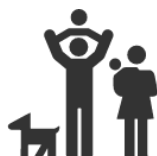
Libertad de educación de los padres