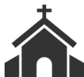
IBI a la Iglesia