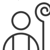
Mofas y/o acoso a sacerdotes, religiosas y fieles