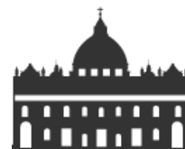
Acuerdos con la Santa Sede