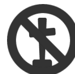
Prohibición / retirada de crucifijos