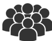
Actos religiosos públicos